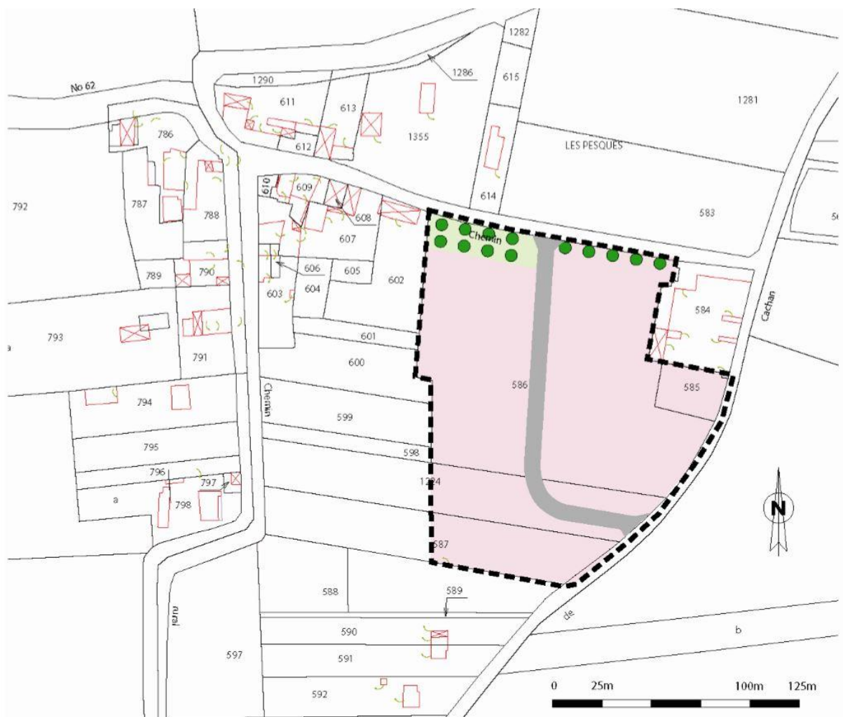
SCHÉMA DE PRINCIPE D'ORGANISATION DE LA ZONE AU0 DES PESQUES